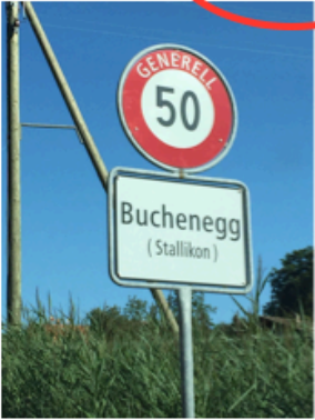
Ortseingangsschild Buchenegg (von Stallikon kommend)